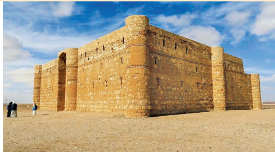
Il Castello di Kharana