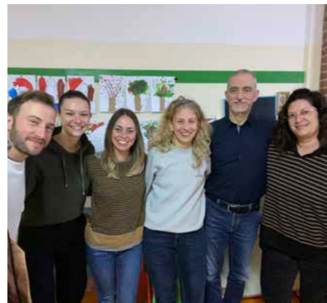
foto: Nuovo gruppo dirigente.