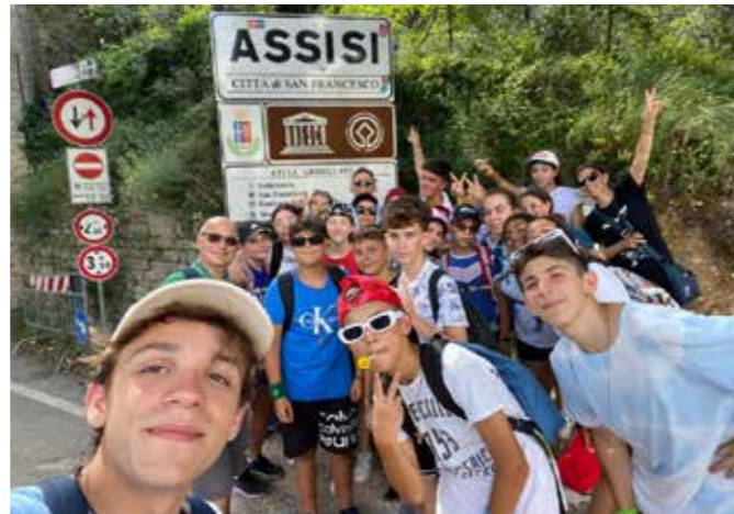
foto: Campo ad Assisi.