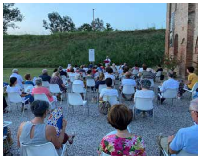
foto: Bibbia sull’Argine. Edizione dedicata al profeta Geremia. A Felonica.