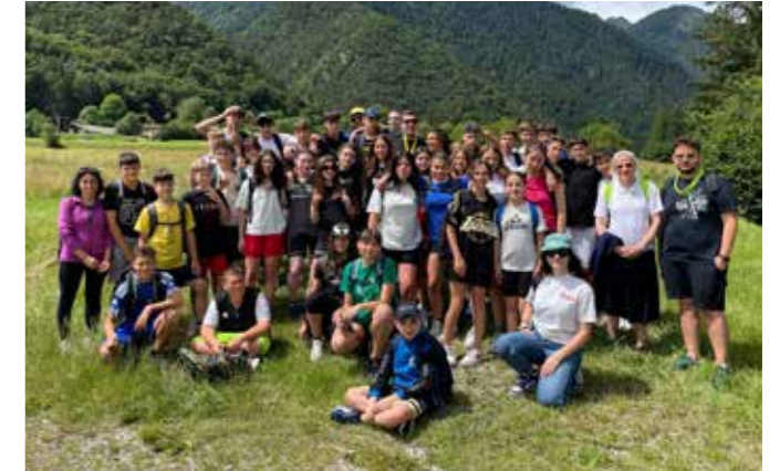
foto: Campo a Lenzumo di Ledro.