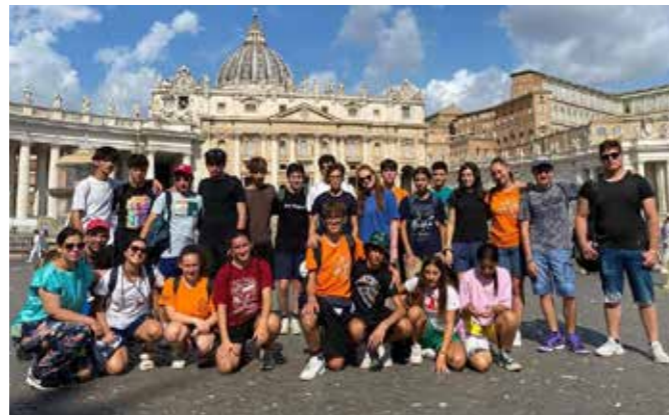
foto: Esperienza di servizio alla Caritas di Roma con gli adolescenti.