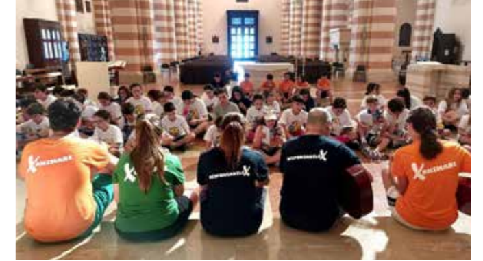
foto: il Grest dell'unità pastorale TuxTutti.