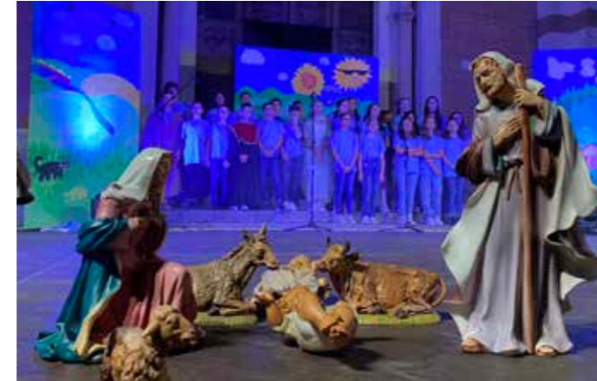
foto: il musical dei ragazzi su San Francesco.