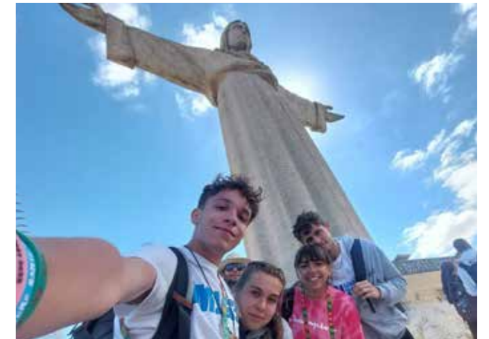
foto: la delegazione dei nostri ragazzi alla GMG di Lisbona con i giovani di tutto il mondo.