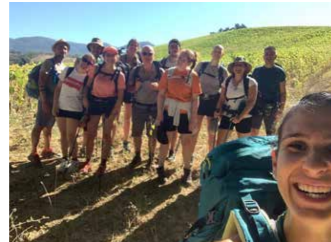
foto: il cammino dei borghi silenti. Con i giovani in Umbria.